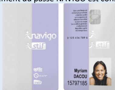
Exemple de Passe Navigo non détecté

Certaines générations de passe Navigo peuvent être non détectés par le système de verrou électronique sécurisant la porte d'un parking à vélos. Dans ce cas le remplacement du passe NAVIGO est conseillé auprès d'une agence RATP.